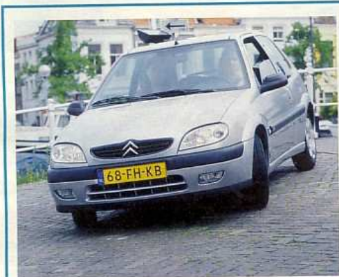
Kijfbrug Noord t.h.v. Haven