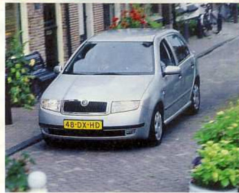
Kijfgracht (even zijde)