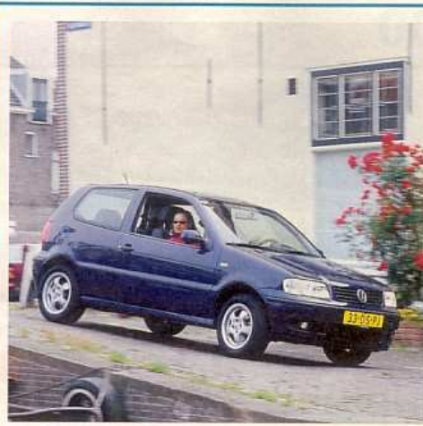
Kijfgracht (even zijde)