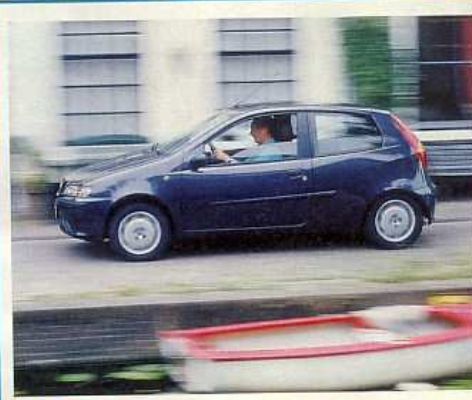
Kijfgracht (oneven zijde)